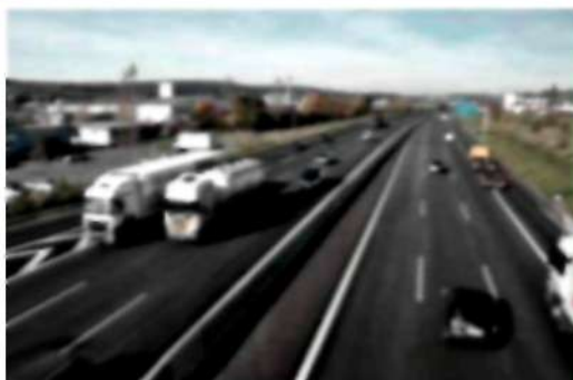
Реконструкция шоссе Авиаторов