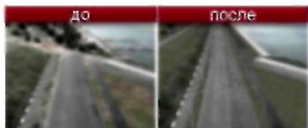
Нулевая Продольная магистраль