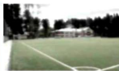
Загородный клуб «Олимпия»